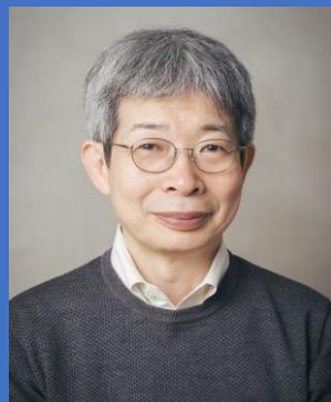
学長 平田 オリザ

芸術文化観光専門職大学は、兵庫県但馬地域初の4年制高等教育機関として令和3年4月に開学しました。1学部1学科で芸術文化と観光を学ぶ全国初となる「芸術文化・観光学部」の強みを生かし、地域社会をフィールドとした実習や実践教育、分野を横断し地域活性化に資する研究の推進、地域の多様な主体と協働した地域貢献活動に取り組んでいきます。皆さまのあたたかいご支援をよろしくお願いいたします。