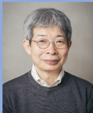
学長 平田 オリザ

芸術文化観光専門職大学は、兵庫県但馬地域初の4年制高等教育機関として令和3年4月に開学しました。1学部1学科で芸術文化と観光を学ぶ全国初となる「芸術文化・観光学部」の強みを生かし、地域社会をフィールドとした実習や実践教育、分野を横断し地域活性化に資する研究の推進、地域の多様な主体と協働した地域貢献活動に取り組んでいきます。皆さまのあたたかいご支援をよろしくお願いいたします。